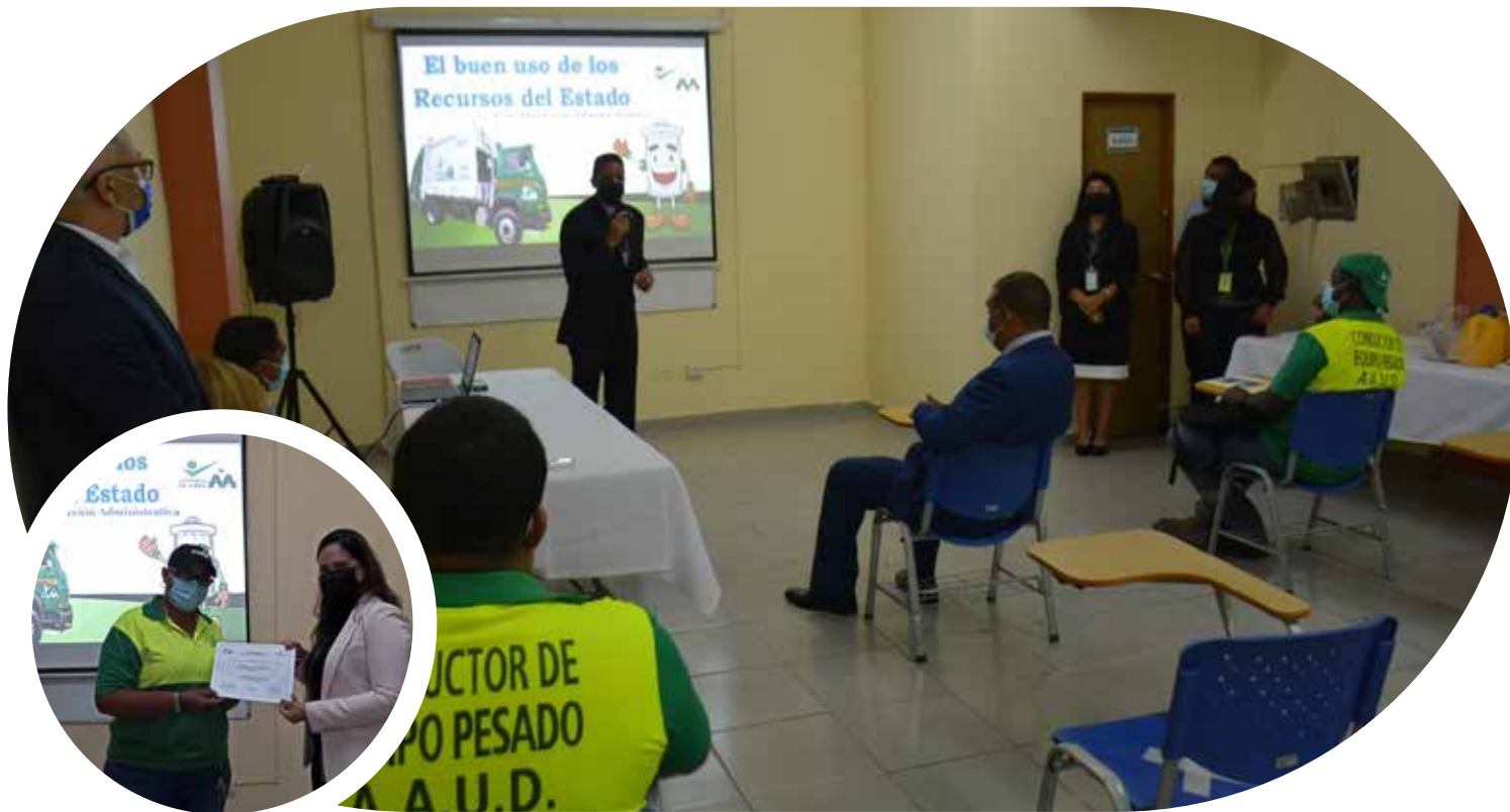
Capacitación sobre “El buen uso de los bienes del estado”