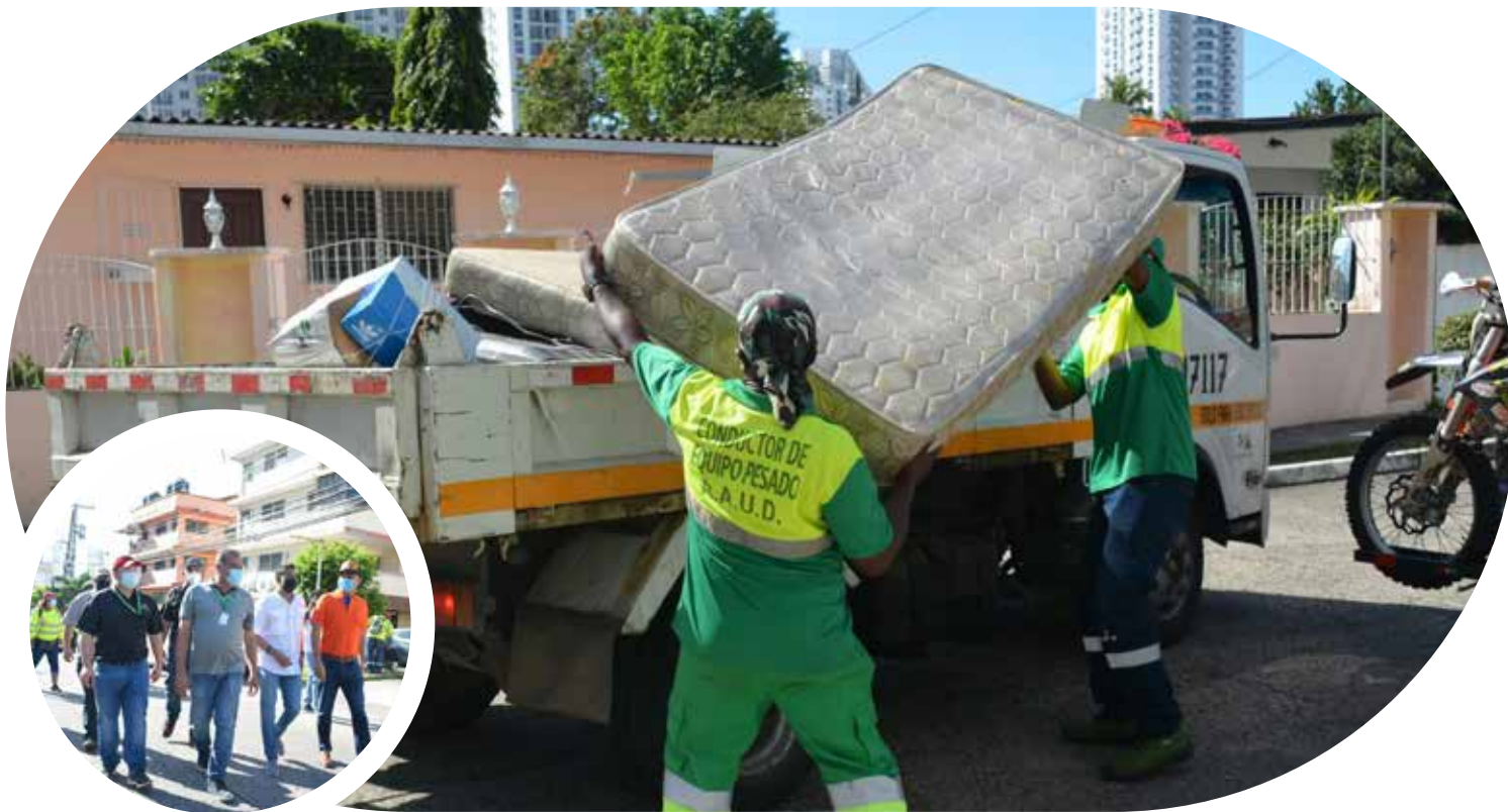
Jornada de limpieza en el corregimiento de Pueblo Nuevo