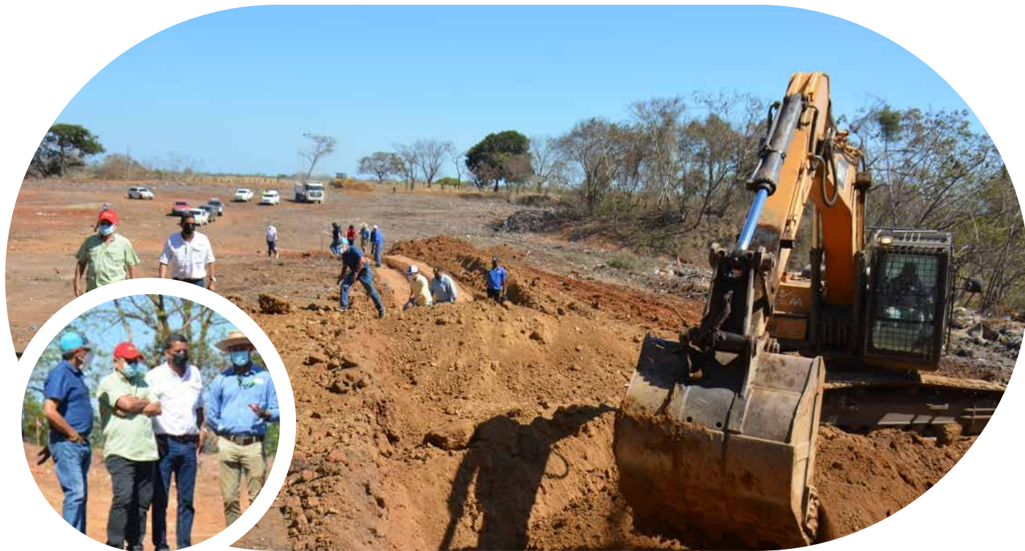
Recorrido en los trabajos de adecuación en el vertedero de Pedasí, provincia de Los Santos