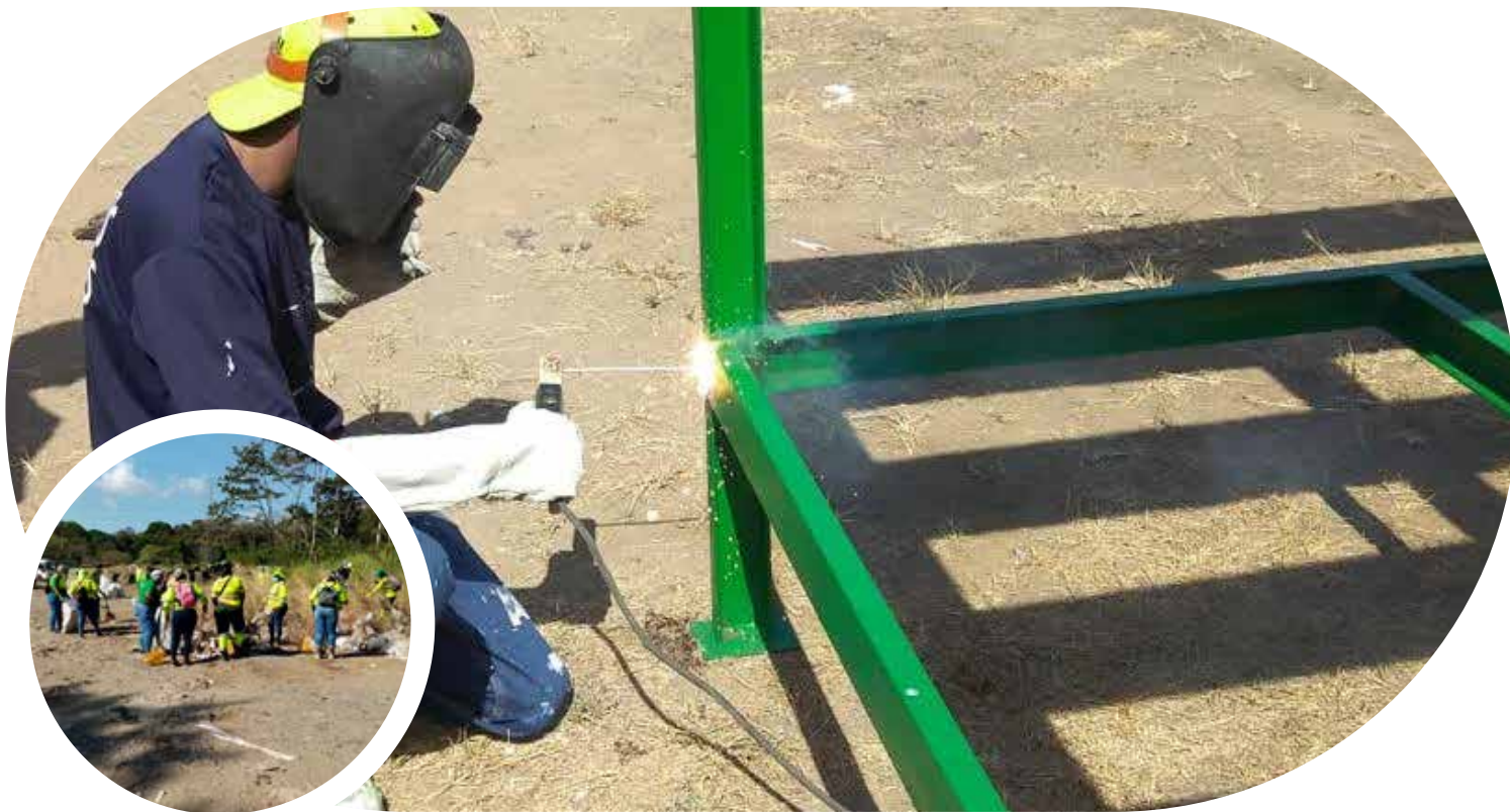
Trabajos de refuerzo de la tarima de tanque de reserva de agua en la Zona D. Patacón.