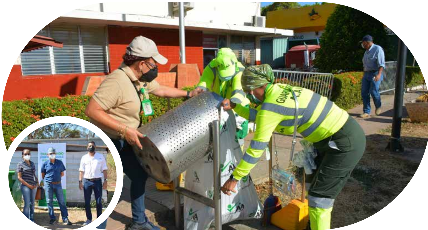
Jornada de limpieza y barrido en el distrito de Las Tablas